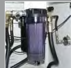
IKZ - Doppelfilter - System