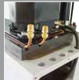
Radiatoren - Platte