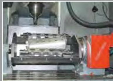
Anwendungsbeispiel 4. Achse